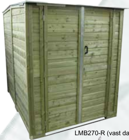
LMB270-R (vast dakdeel)