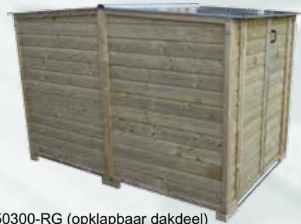
LSC150300-RG (opklapbaar dakdeel)