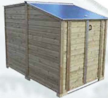
LSC150300-RGH (opklapbaar dakdeel)